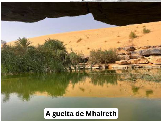
A guelta de Mhareith

O sector atópase na rexión do Adrar, aproximadamente a 2 km ao sur do oasis de Mhareith, dentro dun antigo cauce fluvial seco coñecido como o canón de Thembegith.