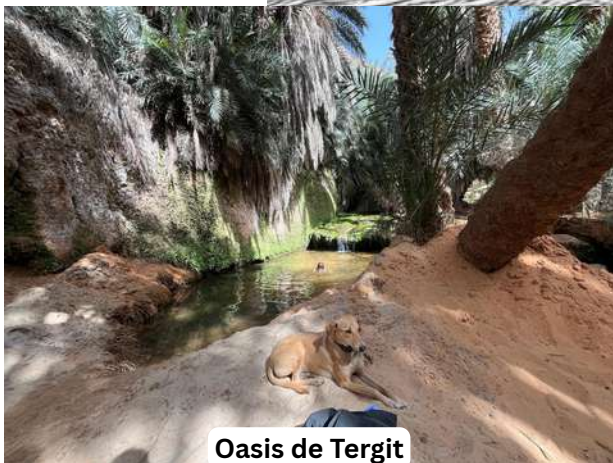
Oasis de Tergit